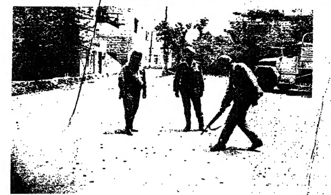
رجال الابن في الدكوانة اسماء كثيرة من الرصاص فارغ

ورزعا بعض العناصر على المارق القريبة ومدخل البنية ، وارسلت دوريات للدور ومن الدكوانة الى الخيمة القاصه